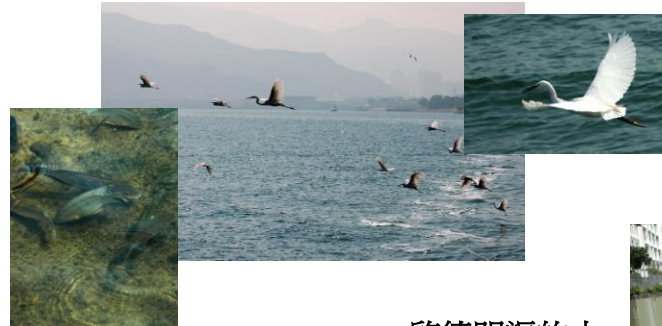
啓德明渠的水質也有改善