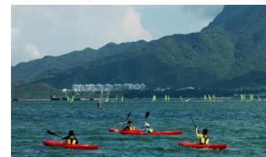
更多市民在吐露港進行水上活動